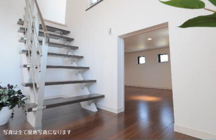
写真は全て現地写真になります