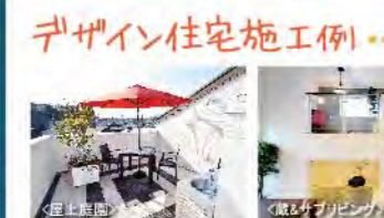
デザイン住宅施工例