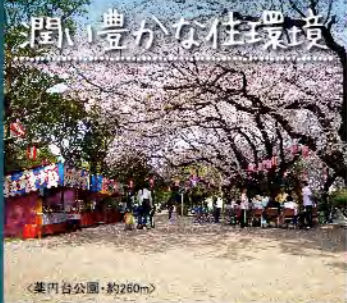
閑い豊かな住環境

所在地/船橋市高根台3丁目・土地/89.10㎡ (26.95坪)・建物/101.42㎡ (30.67坪)・間取り/4LDK・構造/木造2階建・用途地域/第一種中高層住居専用地域・建ぺい率/60%・容積率/200%・建築確認番号/第16UD11K建00026号・販売価格(税込)・現況/完成済(H28年12月)・取引態様/代理