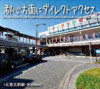
都心方面にダイレクトアクセス