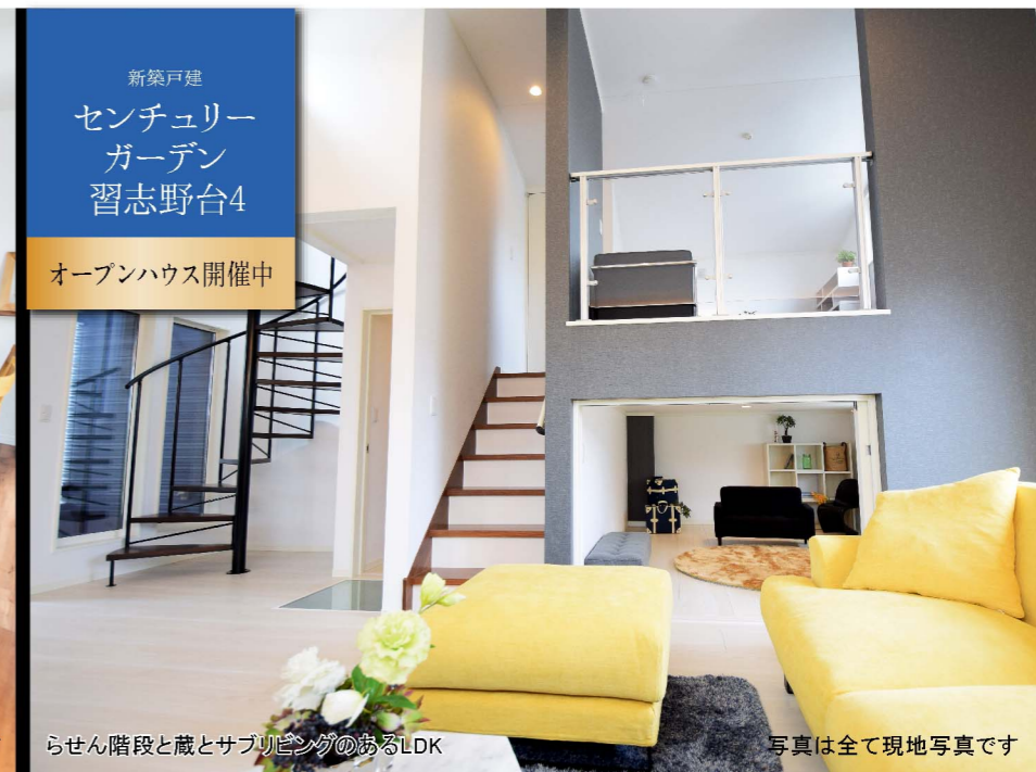
リビング 写真は全て現地写真です