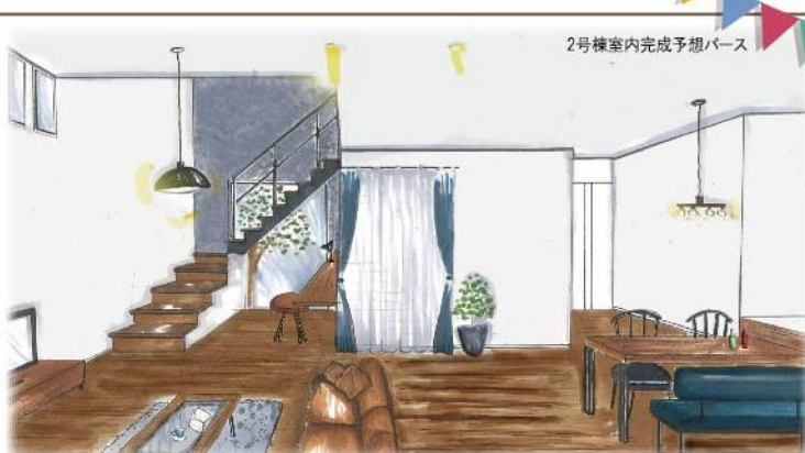
2号棟室内完成予想パース

■所在地/船橋市習志野台5丁目35-24 ■土地/No.1/90.01㎡(27.23坪)、No.2/113.73㎡(34.40坪)、No.3/126.83㎡(38.36坪) ■建物/No.2/97.91㎡(29.62坪)、No.3/94.80㎡(28.68坪) ■土地権利/所有権 ■地目/宅地 ■用途地域/第一種中高層住居専用地域 ■建ぺい率/60% ■容積率/200% ■土地価格[建築条件付き売地]/No.1/1,700万円 ■新築価格[新築戸建]/No.2/3,480万円(税込) No.3/3,380万円(税込) ■構造/No.2&No.3/木造2階建 ■間取り/No.2&No.3/3LDK+カーブスペース ■設備/都市ガス/公営水道/下水道 ■引渡/相談 ■現況/No.1/更地/No.2&No.3/建築中(令和1年11月完成予定) ■取引態様/売主